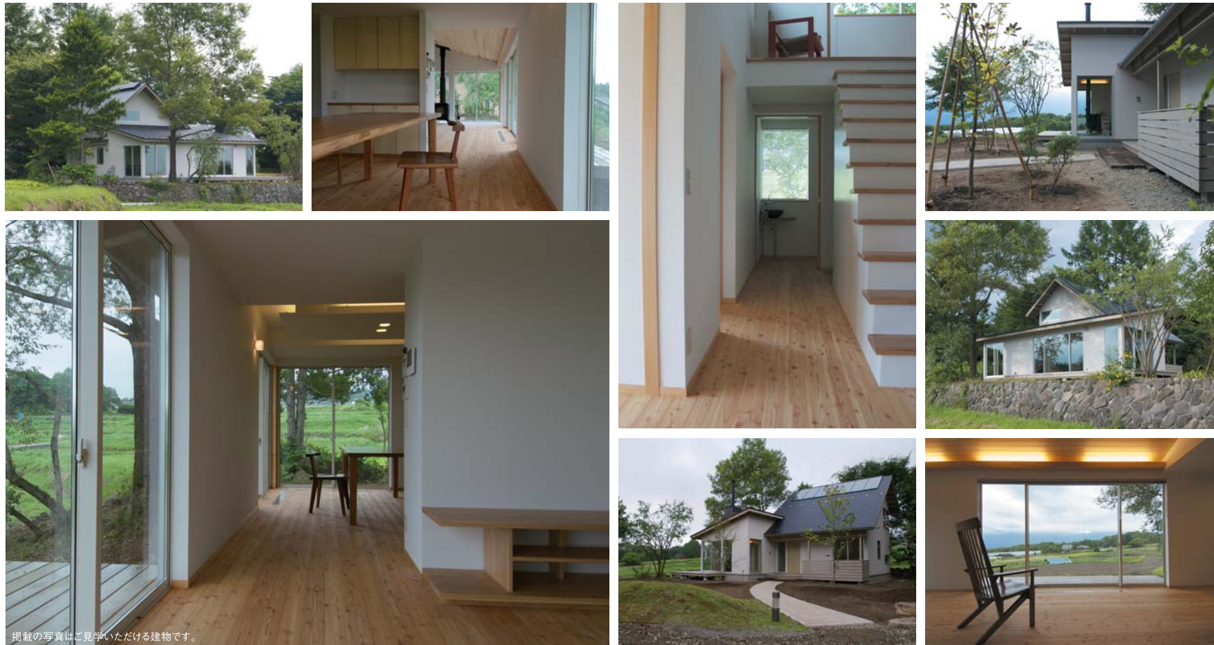
掲載の写真はご見学いただける建物です。

屋根下で温められた空気は、棟へあがり屋根上に設置されたチャンバーで集められます。集められた空気は、屋内に設置するリターン口と取込ファンを経た後、ダクトで床下へと導かれるシンプルな仕組みです。