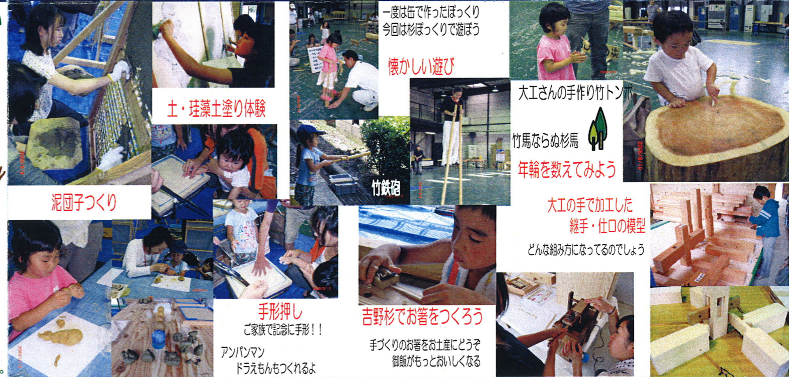
土・珪藻土塗り体験