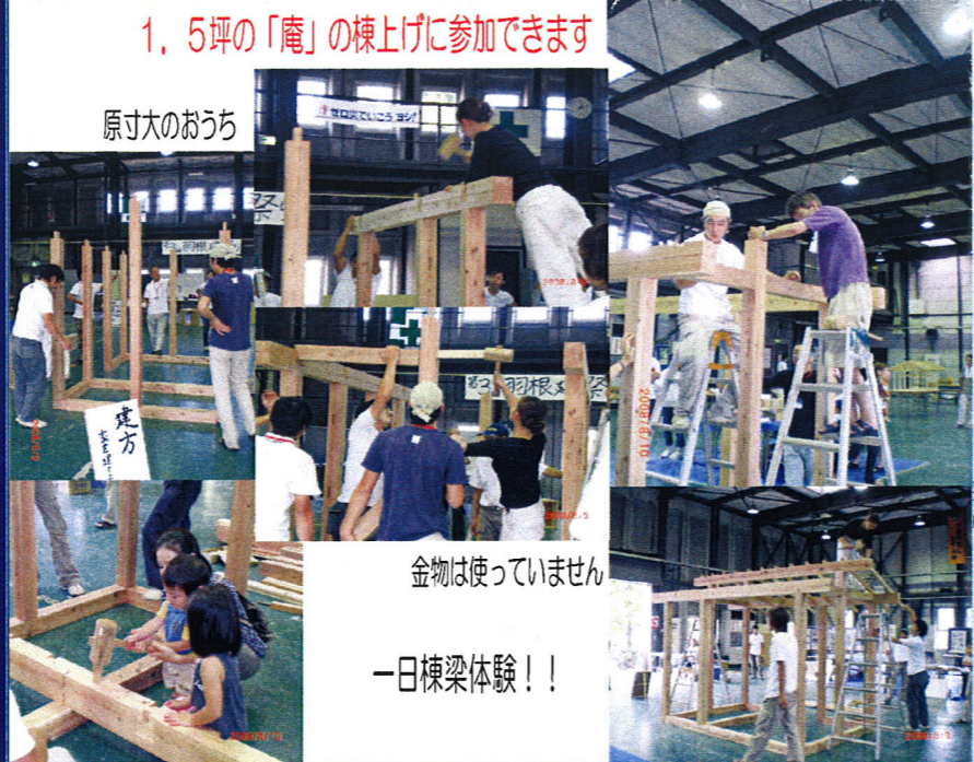
1.5坪の「庵」の棟上げに参加できます

交通アクセス ・大阪モノレール「摂津」駅下車 南(摂津市役所方向)へ徒歩約7分 ・JR「千里丘」駅東口からバス(2番乗り場)「摂津市役所前」下車徒歩1分